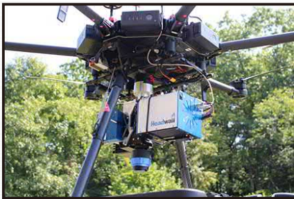
同时挂载Micro-Hyperspec SWIR和HyperCore嵌入式采控电脑